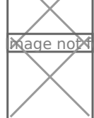
Image not found or type unknown. Vous arrivez sur la page ci-dessous :

Suivez la procédure décrite à droite de l'écran ci-dessus dans le pavé " Informations ".